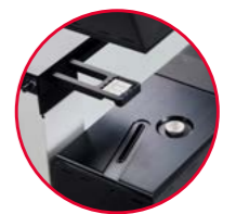
vollautomatische, dreistufige Justiereinheit mit auswechselbaren Standard-Endmaßkörpern