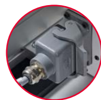
robustes, langlebiges Industriedesign