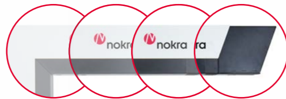
Ausführungen Messtiefe C-Bügel 500 / 1000 / 1500 / 2100 mm

Der Verformungssensor erfasst kontinuierlich mit der Abtastfrequenz der Triangulationssensoren den Abstand der beiden C-Bügel auf 0,5 µm genau. Jede Veränderung wird sofort automatisch kompensiert.